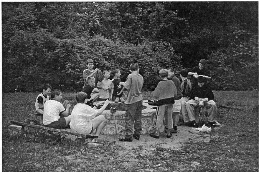
Eső és túra után: a cipőtisztításban a fiúk jeleskedtek