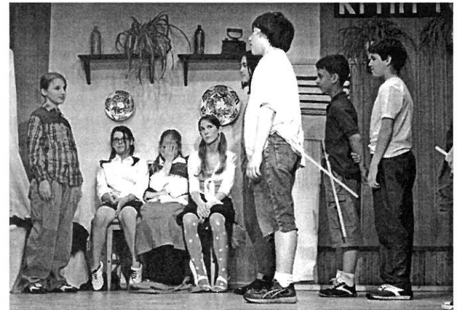
Tojások (5. b)