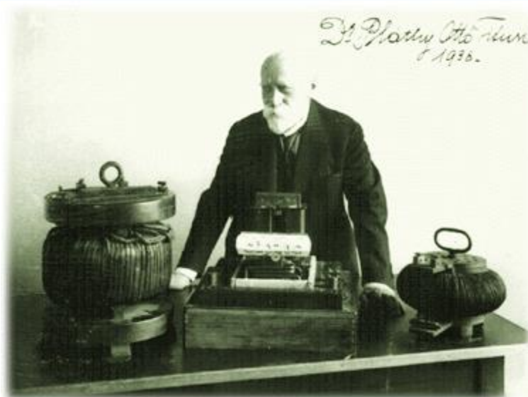
Bláthy Ottó találmányai körében

A bécsi Műegyetemen végezte tanulmányait, majd 1883-tól elektrotechnikai kutatásokat végzett a Ganz-gyárban. A villamossági üzemben 1885-ben Zipernowsky Károllyal és Déry Miksával feltalálta a energiaátvitelre is alkalmas zárt vasmagú transzformátort. Számos egyéb találmánya is volt, például a fogyasztásmérő és a háromfázisú generátor is. Nagyszerű fejszámoló és sakkozó volt, egy időben a Magyar Sakkszövetség elnöke. Nevéhez fűződik a világ leghosszabb illegális sakkeladványa, matt 292 lépésben. Magyarországon több középiskola viseli a nevét.