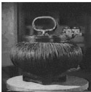
Bláthy Ottó Titusz, Déri Miksa és Zipernovszky Károly zárt vasmagú transzformátora, 1885

Emlékezetére a Magyar Elektrotechnikai Egyesület 1958-ban "Bláthy Ottó Titusz-díj" néven évenként kiosztásra kerülő kitüntetést alapított.